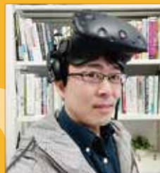
四国大学 経営情報学部 メディア情報学科 准教授