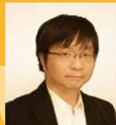
ユニティ・テクノロジーズ・ ジャパン合同会社 プロダクト・エヴァンジェリスト/ 教育リード