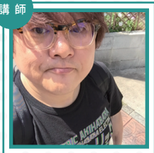
アニメ監督 水島精二氏

演出・監督として30年間に渡って活躍。近年ではピクシブ発のユニット“虹のコンキスタドル”の結成にも協力、活動の幅を広げている。