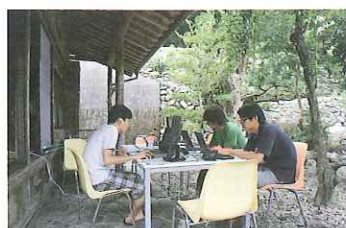
(株)ダンクソフト 「ICTを活用したサテライトオフィス」