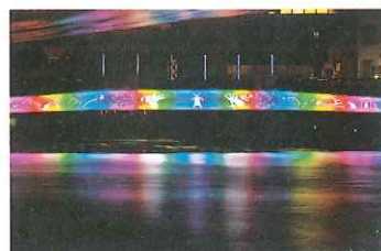
(公財)徳島経済研究所 「徳島LEDアートフェスティバル2013」