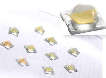
日亜化学工業(株) 「光の質にこだわったパワーLED」