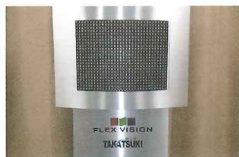
高槻電器工業(株) 「軽量可搬型LEDディスプレイ(FLEX VISION)」